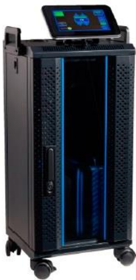
H Hygiene Solution 200-400 (Raumvolumen 200-400 m 3 )

Unschädlich für Menschen, fühlen Sie sich wohl, sicher und geschützt durch permanente Hygienisierung der Raumluft und der Oberflächen während der Arbeit, ohne den Raum zu verlassen . Mit dem H Hygiene 200-400 Gerät in Verbindung mit der gebrauchsfertigen NeutroDes AIR Lösung, kann die Ansteckungsgefahr durch Tröpfcheninfektion in geschlossenen Räumen massiv gesenkt werden. Die Oberflächendesinfektion mit Langzeiteffekt desinfiziert alle Oberflächen im Raum, sodass Sie sich wieder auf die Reinigung konzentrieren können. Das einzigartige Verfahren inaktiviert Viren und Bakterien in der Luft in den Aerosolen - den ganzen Tag.